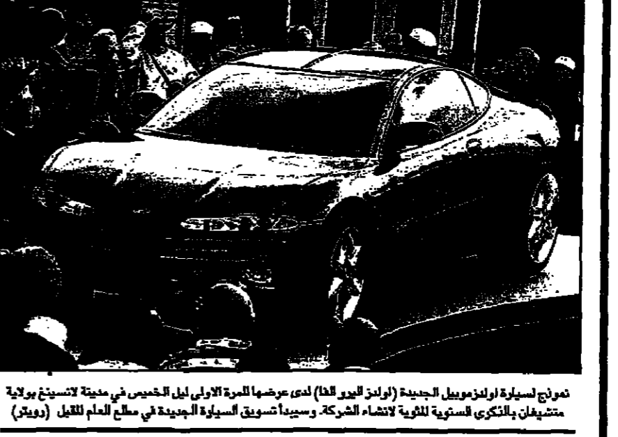
معرض لسيارة فولكسفاغن الجديدة (فولكس فاغن جيتا) لدى عرضها للمرة الاولى ليل الخميس في مدينة لاسينج بولاية ميتشغان والكبرى السنوية للثلاثاء لشركة سيدا للسيارة الجديدة في مطلع العام لليل (رويتز)